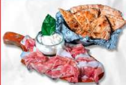
STRACCIATELLO € 11,90

Delicato e leggero, con prodotti locali Sottilissimo Prosciutto Crudo 24 mesi selezione Tessarin e Straciatella di burrata veneta. Servito con la schiacciata calda di impasto POLESANISSIMO® al Rosmarino.