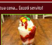
COPPETTA FRAGOLE € 2,90

Soffice gelato fiordilatte, nutella, biscotto alla nutella, panna montata e nocciole.