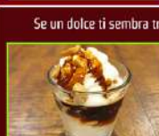
COPPETTA CARAMELLO € 2,90

Un classico della tradizione contadina, il dolce più amato da grandi e piccoli. Cacao, biscotti, burro e uova, come da ricetta tradizionale della nonna.