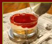
CHEESECAKE ALLE FRAGOLE € 4,90

Coppa piena di soffice fiordilatte, con Baileys e topping al cioccolato. Disumano!