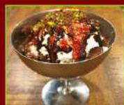
GELATONE SACRO GRAAL € 4,90

Coppa piena di soffice fiordilatte, con granella di nocciole e crumble di cioccolato, culis di fragole e topping al cioccolato. Definitivo, immortale e immorale!