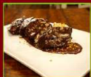
DOLCE SALAME € 4,90

Il dolce che mette tutti d'accordo! Crunch di biscotti, crema dolce di ricotta polesana, e Nutella.