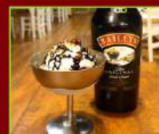
GELATONE BAILEYS € 4,90

Il tradizionale tiramisù con la Esse Adriese al posto del Savoiardi: dolce 100% Polesano. Con crema artigianale al mascarpone, Esse Adriese, caffè cacao.