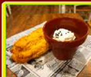
ESSEMISÙ NEL COCCIO € 5,90

Se il Pistacchio ti fa impazzire questo è il tuo dolce. Un morbido tortino caldo con un cuore di deliziosa crema di pistacchio.