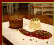
PISTACCHIO LOVERS € 4,90

Coppa piena di soffice fiordilatte, con granella di nocciole e crumble di cioccolato, culis di fragole e topping al cioccolato. Definitivo, immortale e immorale!