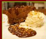
CHEESECAKE ALLA NUTELLA € 4,90

Irresistibile, con base di biscotti fragranti al burro, crema dolce di ricotta polesana, e salsa di fragole.