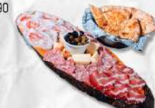
TAGLIERE DI CAMPAGNA 100% POLESINE € 17,90

Mix di selezionati salumi artigianali locali Polesani e formaggi del pastore del Delta del Po. Servito con la schiacciata calda di impasto POLESANISSIMO® al Rosmarino.