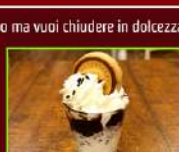
COPPETTA NUTELLA BISCUIT € 2,90

Soffice gelato fiordilatte, caramello salato, panna montata e arachidi.