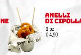
ANELLI DI CIPOLLA